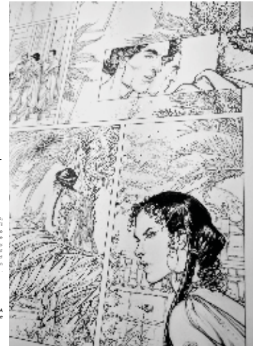
Planche MURINA sans encrage

L'entreprise d'Édition Dargaud a une histoire qui remonte à la fin du XIXe siècle. C'est dans la lignée de la maison d'édition que se trouve la plus grande part de la production de la bande dessinée en France. La liste de genres sur lesquels Dargaud a été le plus innovateur : Black History, Polar, Thriller, Biographie, Documentaire, Fantasy. La maison d'édition, qui est très importante pour nos auteurs, leur propose un style et un traitement graphique, ainsi que la diffusion de leurs œuvres, et dans le catalogue, c'est principalement ce qui propose une maison d'édition qui correspond vraiment à nos valeurs (qualité, savoir-faire) et créatives.